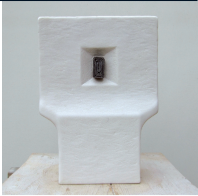
Form 6 / 2007, Marmor und Blei, H - 39,5 / B - 28 / T - 12,5 cm

Hartwig Ullrich, geb. 1932 Studium an der WKS Wiesbaden und an der HBK Hamburg. Seit 1980 Professor für Plastisch-räumliches Gestalten an der HAWK Hildesheim. Lebt und arbeitet in Dinklar.