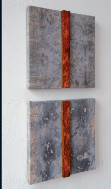
Günter Wagner: „Vertikales Diptychon“, zweiteilig, 2006, Blei (patiniert) und Granit (eisenbeschichtet und patiniert) auf Holz, 65 x 30 x 6 cm.

• Auch Angelika Summas Drahtgeflechte aus schwerem Baustahl, deren Bewegtheit spielerische Leichtigkeit vermitteln, beziehen eine zweite Realitätsebene ein. Die Ambivalenz von Materialeigenschaft und deren Wirkung macht ein wesentliches Moment ihrer Kunst deutlich: den Bezug zum Menschen.