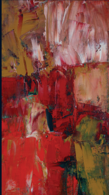
„Flammenlaub“, 2007 Sand und Öl auf Leinwand 100 x 50 cm

Weitere Informationen unter: http://bbk-hildesheim.de/kuenstler1.php?Kuenstler_ID=29