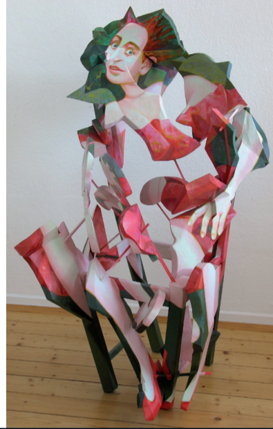
„Sitting together“, 2006 Acryl auf Holz und Pappmachee, ca. 128 x 90 x 90 cm

Malgorzata Konverska, geb. 1943 in Posen, Polen. 1964 bis 1970 Studium an der Hochschule für Bildende Künste, Posen. Diplom im Fach Malerei und Grafik. Lebt und arbeitet seit 1983 in Hannover.