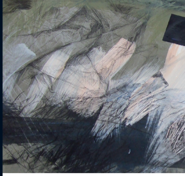
Zeichnung 1 (Ausschnitt), Mischtechnik, 70 x 100 cm, 2007

Ingeborg Ullrich, geb. 1943 Studium an der Fachhochschule in Hamburg. Lebt und arbeitet in Dinklar.