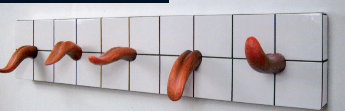
Impressionen aus der BBK Jahresausstellung 2007 Arbeit von Jan Obornik

2. Nov. bis 3. Dez. 2008 Finissage 6. Dez. 2008